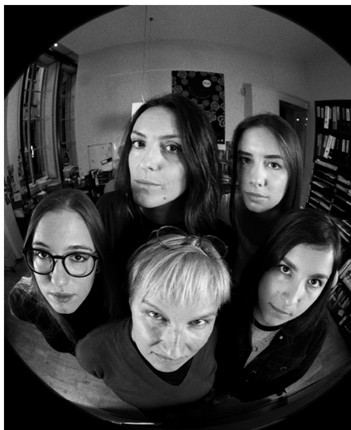
Derrière cette revue, une team de talents créatifs et curieux.